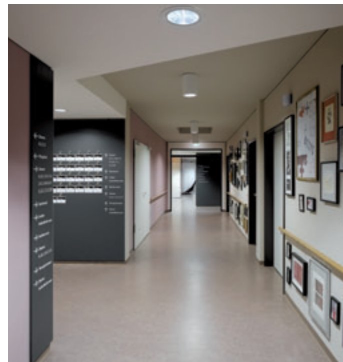
Lebendiges Orientierungssystem und bunte Bildwand mit Zeitgeschichte, Buntem und Hintersinnigem aus über 100 Jahren

Mit der Eröffnung von KSP Domizil im Gesundheitszentrum beim Kreiskrankenhaus Schorndorf am Samstag und Sonntag bietet die Kranken- und Seniorenpflege KSP erstmals in Schorndorf ergänzend zur ambulanten Versorgung auch Lang- und Kurzzeitpflegeplätze an.