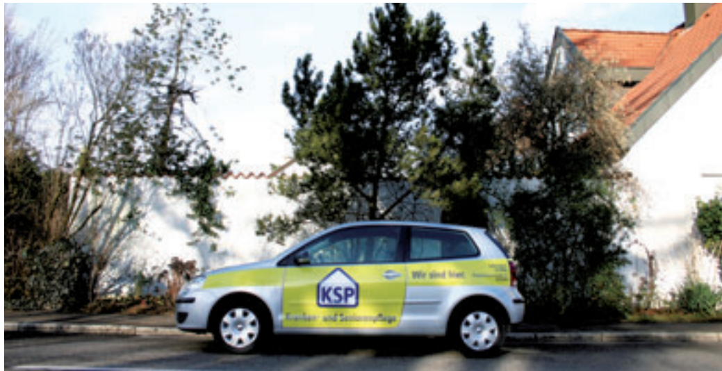
Ständig in Schorndorf und Umgebung unterwegs: eines von 15 KSP-Mobilen