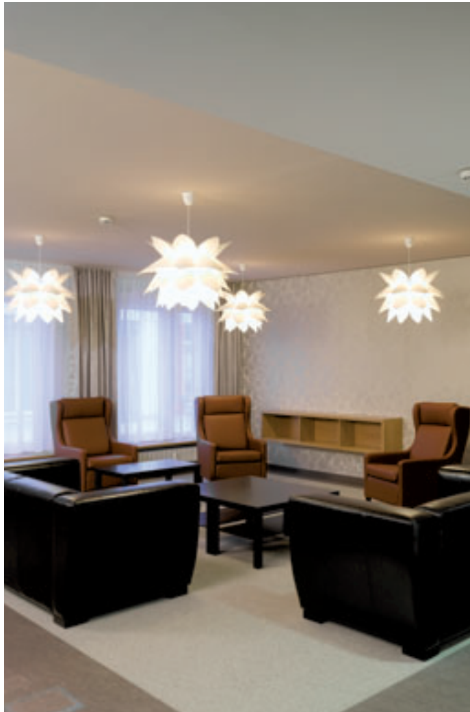
Warme Farben: der große Aufenthaltsraum